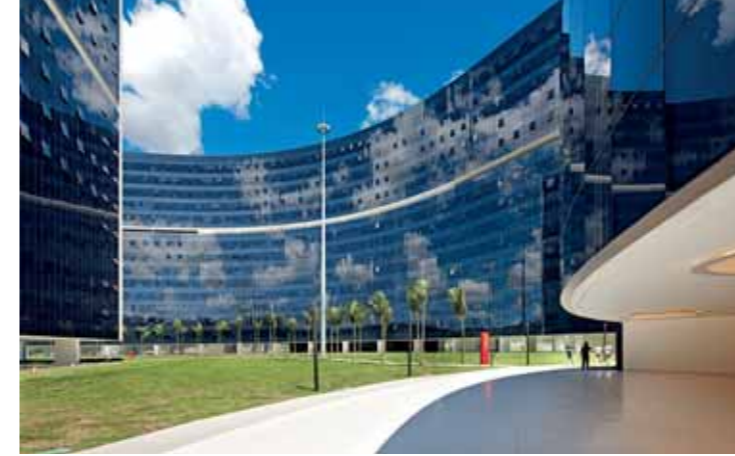
Cidade Administrativa Minas Gerais - Brazil 22.000 tende in vetrocamera ScreenLine 22,000 ScreenLine integrated blind systems

ScreenLine Benelux | ScreenLine BR | ScreenLine CZ | ScreenLine France | ScreenLine GmbH | ScreenLine Nordic | ScreenLine UK | ScreenLine Africa | ScreenLine India | ScreenLine Ibérica