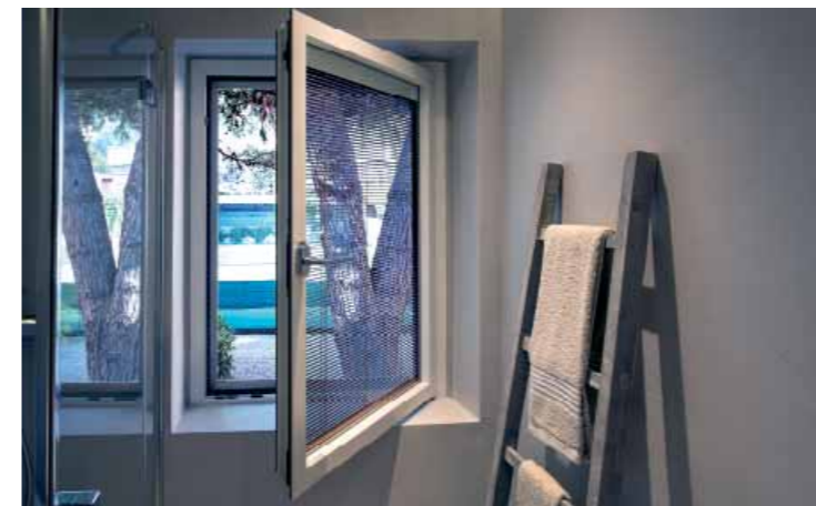
Residenza privata / Private house Tenda motorizzata ScreenLine su finestra ad un'anta ScreenLine motorised blind on casement window