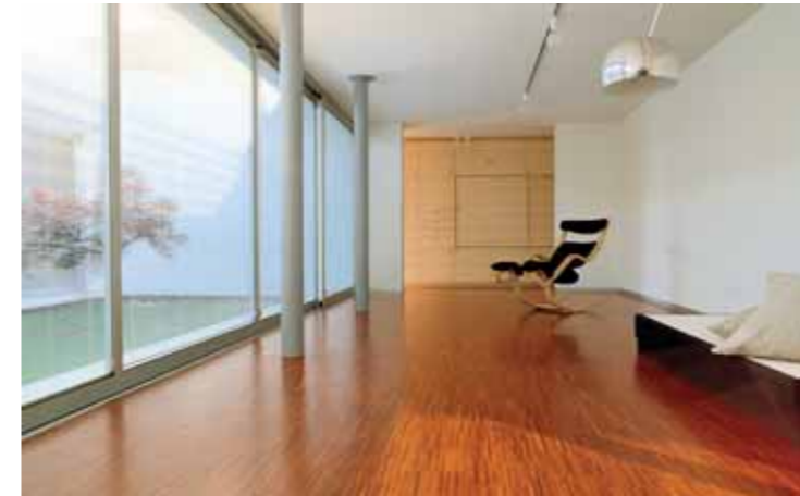
Residenza privata / Private house Tende ScreenLine su grandi serramenti scorrevoli ScreenLine blind systems on large sliding windows